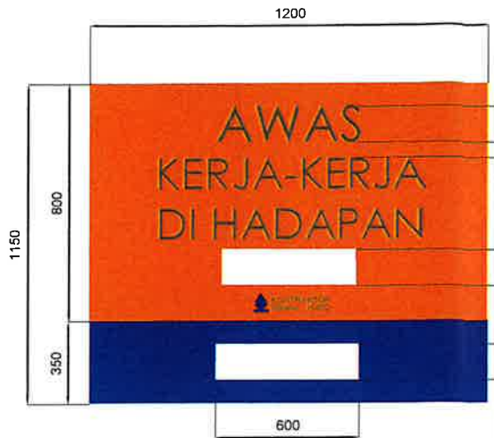
ADVANCE WARNING SIGN _____m