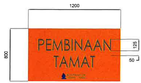
WARNING SIGN PEMBINAAN TAMAT